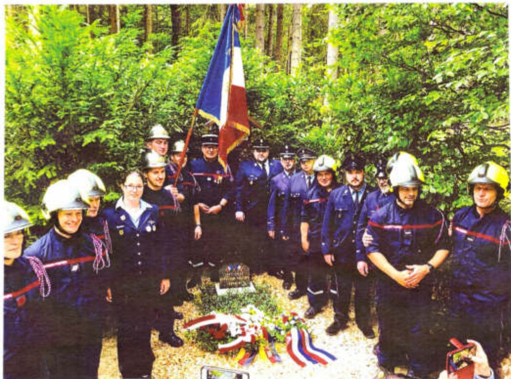
Feierliche Zeremonie am vorderen Franzosengrab