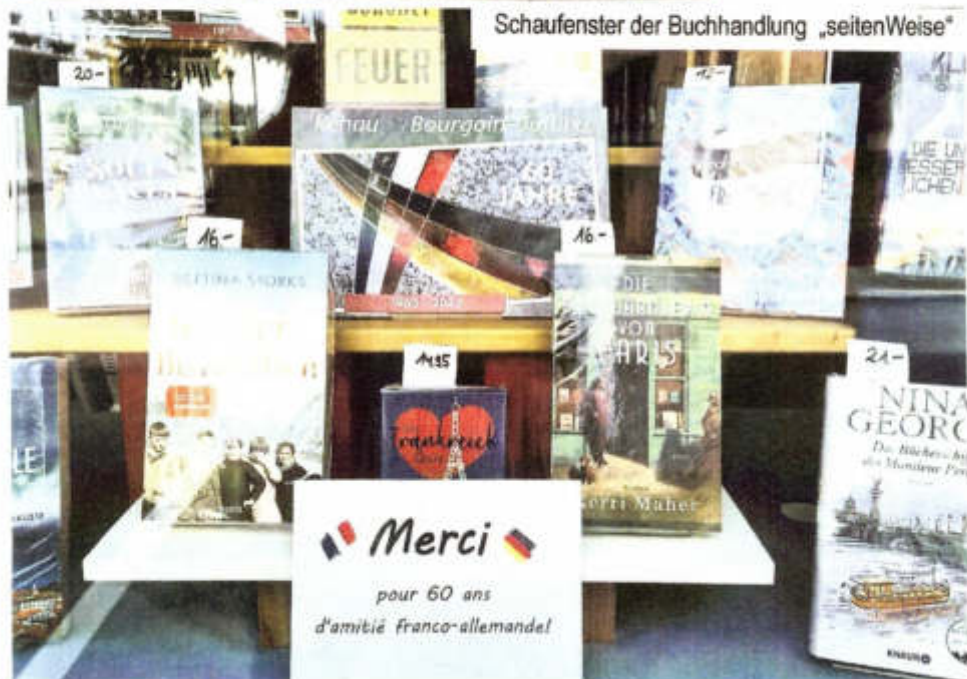
Schaufenster der Buchhandlung „seitenWeise“